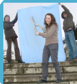
Sesiunea foto pentru realizarea posterului SNV 2009!

Voluntarii și personalul Pro Vobis au lucrat cot la cot la împachetarea și expedierea celor peste 40 de colete cu materialele promoționale SNV realizate de Pro Vobis în acest an.