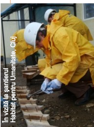
În vizită la șantierul Habitat pentru Umanitate, Cluj

Voluntarele vârstnice din Ungaria și respectiv Slovacia au plecat acasă deosebit de pozitiv impresionate de vizita lor în România, de deschiderea și entuziasmul cu care au fost primite în fiecare dintre organizațiile vizitate și de activitățile desfășurate alături de voluntarii români. După ce au revenit acasă, dacă vor dori vor fi sprijinite să implementeze mici proiecte de diseminare a celor văzute și de activare a altor vârstnici din comunitățile lor în sensul implicării în beneficiul comunității.