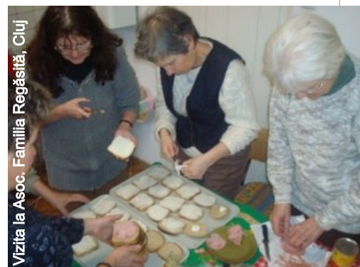
Vizita la Asoc. Familia Regăsită, Cluj