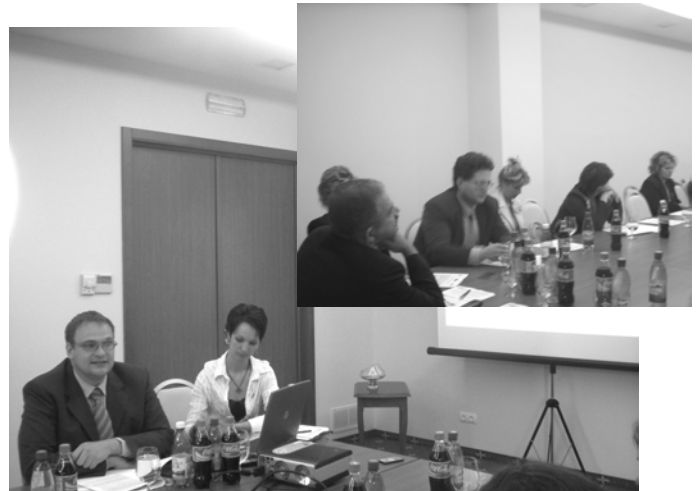
Prima întâlnire pentru crearea coaliției business-to-business în Cluj Napoca (Hotel City Plaza, 29/09/05)

Uniconnect este o companie româno-olandeză care are ca principal obiect de activitate îmbunătățirea relațiilor de afaceri dintre România și Olanda. Compania acționează ca și intermediar între organizații și companii olandeze și potențiali colaboratori din România.